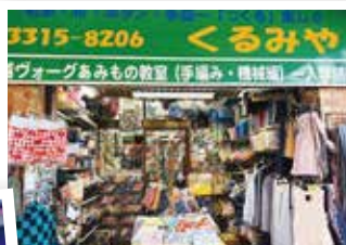
商店街の会長さんの手芸店「くるみや」。手芸用品がところ狭しと並び、客足が途絶えない。手芸教室も開催されている。