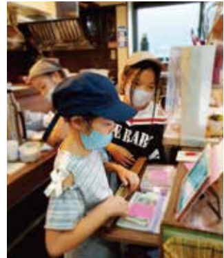
お会計もキッズボランティアが行います。(※大人が1名付きます)